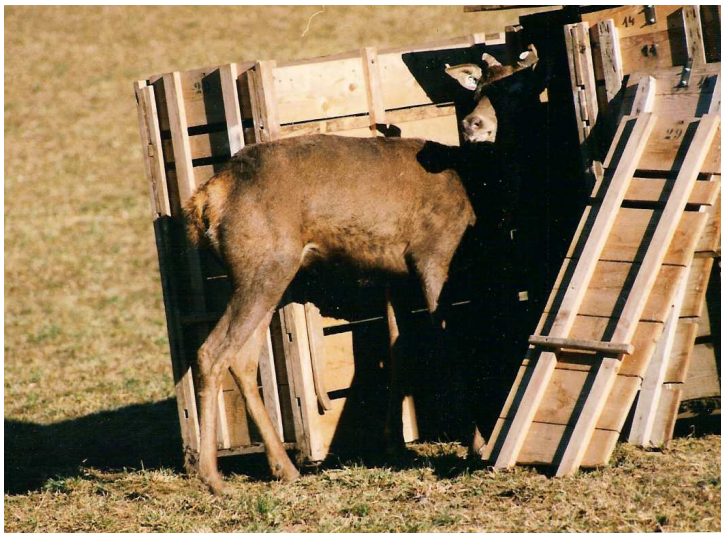
Lâcher de cerfs