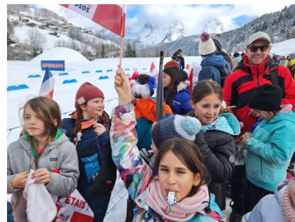
Sortie Biathlon Sprint-Dames le 20/12/24

Pour ces deux activités, les maîtresses ont besoin d'accompagnants, comme il est souvent difficile pour les parents de se libérer, nous lançons un appel aux retraités disponibles qui auraient envie de passer l'agrément ski ou piscine ou tout simplement d'accompagner (présence dans le car pour le ski et aide dans les vestiaires pour la piscine). Pour ce faire, vous pouvez vous présenter à la Mairie, les maîtresses vous en seront très reconnaissantes.