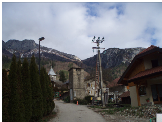
← Avant la démolition

Mise en souterrain du réseau électrique 20 000 volts, démolition et reconstruction du transformateur du Chef lieu. Travaux en coordination Régie d'Electricité de Thônes—commune de La Balme de Thuy