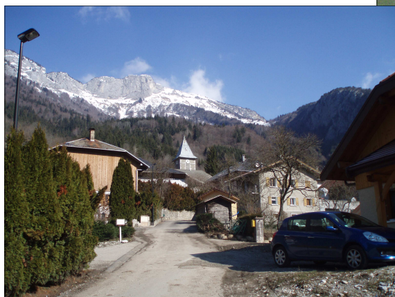
← Après les travaux